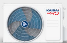
Jednostka zewnętrzna KRP